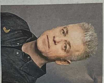
Michael Mittermeier ist nächstes Jahr in Zons dabei.